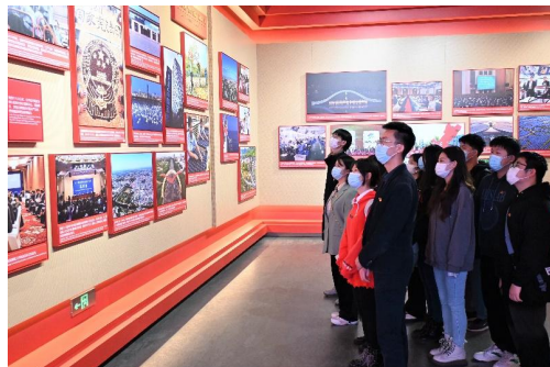
环境学院参观中共一大会址纪念馆