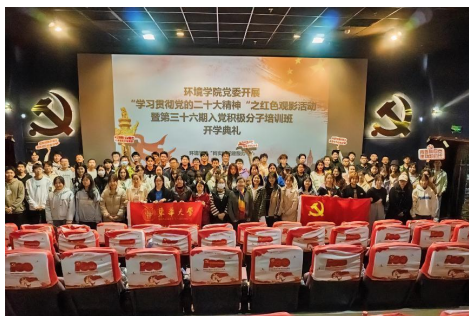
环境学院红色观影活动