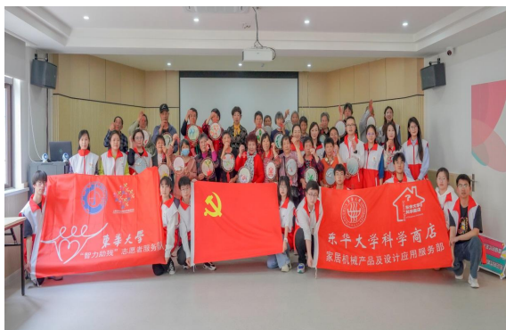
机械学院志愿活动

随后，机械学院科技商店同学展示“磁场铁钉”、“冷火”、“气压中的水元素”、“光压风车”、“电离子魔幻球”五个实验，采用不同形式、从不同的角度让学员们感受到科学的魅力。最后，志愿者向大家讲解二十四节气的渊源，并现场讲解示范二十四节气团扇的编织方法。发展联络处党支部的老师一对一教授“残障”学员编织团扇，感受传统文化的博大精深。