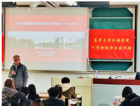
外语学院培训班开班典礼