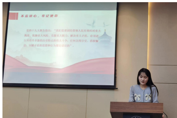
外语学院专题读书会