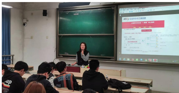
环境学院主题班会