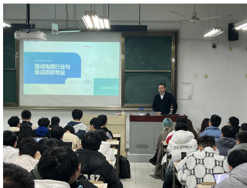
理学院职业生涯规划讲座