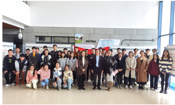
信息学院书法比赛评选快闪活动