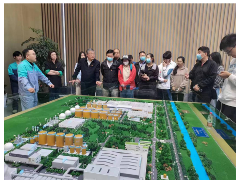
管理学院参观学习活活动