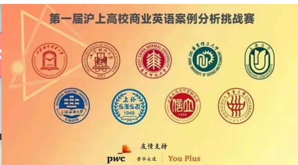
管理学院举办挑战赛