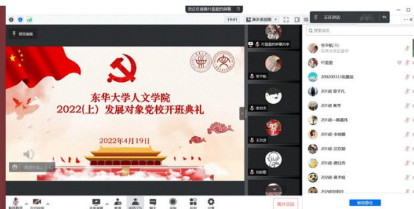
人文学院党校开班典礼