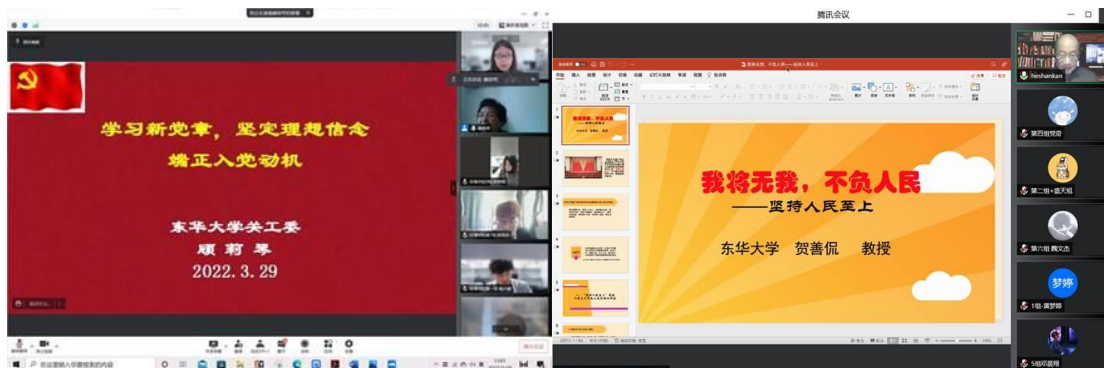
环境学院理论培训课