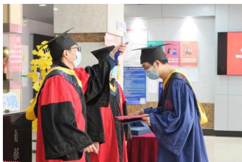
环境学院毕业典礼