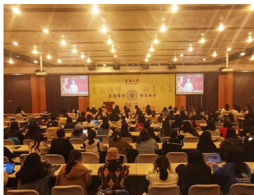
人文学院讲座现场