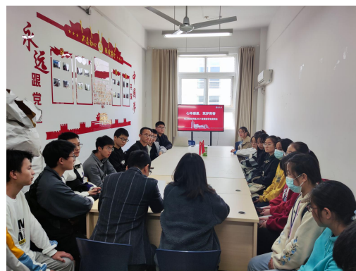
化工生物学院座谈会