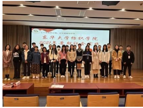
纺织学院暑期实践表彰大会