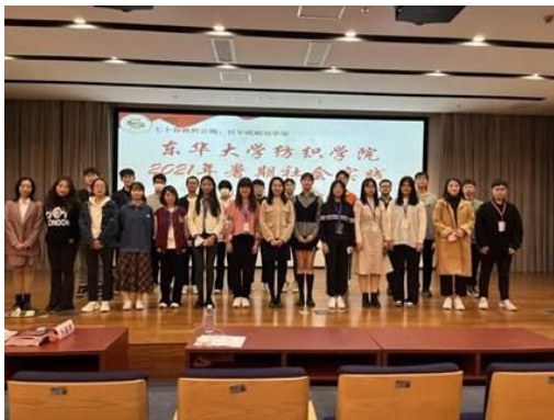
纺织学院暑期实践表彰大会

让全体成员深刻体会到了这笔精神财富的宝贵，并立志要继承先辈遗志，传承红色基因，用实实在在的行动开新局、谱新篇。在庄严的中共一大纪念馆，信息学院本科生第四党支部与人文学院尚实先锋党支部师生党员，面对鲜红的党旗，重温入党誓词，追溯入党初心。通过此次参观活动，党员们纷纷表示要争做时代的先锋、社会的脊梁、群众的楷模，发挥典型示范引导作用，以知促行、以行促知。