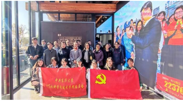
计算机学院参观学习活活动