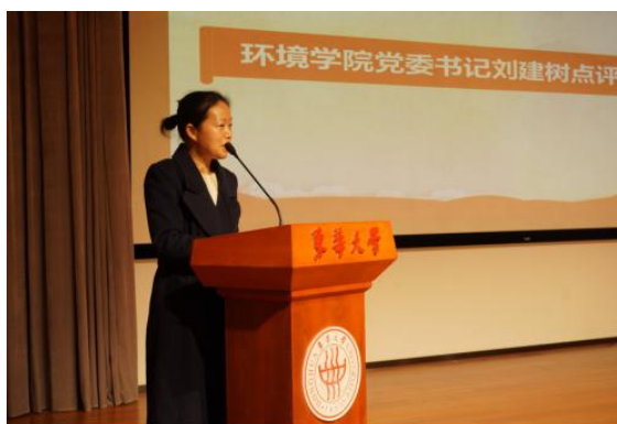
环境学院党章学习小组结业典礼