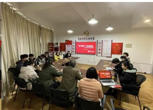
理学院迎新慰问座谈会