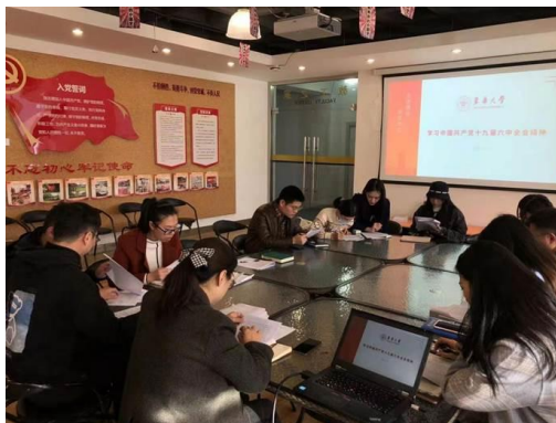
服装学院学习十九届六中全会精神