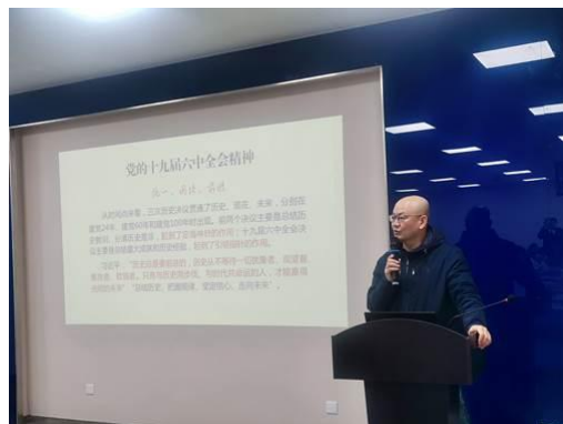
理学院举行辅导报告