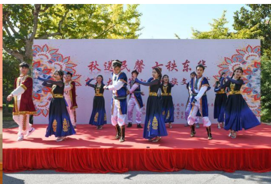
服装学院迎新大会