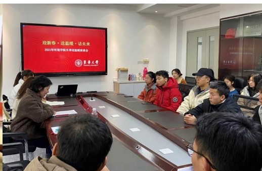
环境学院迎新送温暖活动