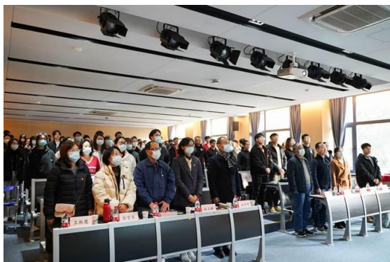
信息学院活动现场