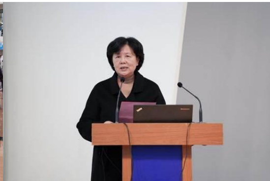
服装学院学风建设总结表彰会