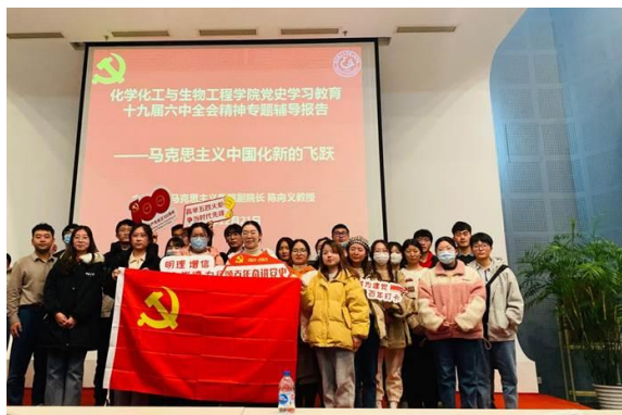
化工生物学院举行党日活动